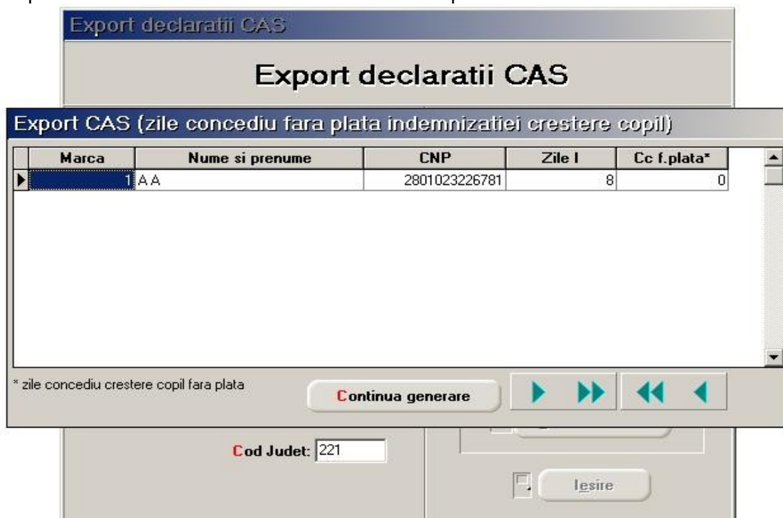
Fig. nr. 3

- La generarea declaratiei de CAS cand apare macheta din fig. nr. 3 nu completati nimic si continuati generarea declaratiei; acele zile se refera la angajatele care au fost in crestere copil de 3 ori iar a patra ora beneficiaza doar de un concediu fara plata de 90 de zile