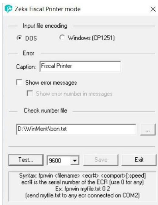
Figura nr. 1 Setări casa de marcat

Interfațarea caselor de marcat ACTIVA sau TREMOL în regim de emulare tastatură este făcută prin intermediul driver-ului FPRWIN , pus la dispoziție de către firma importatoare a acestor tipuri de case. Driverul FPRWIN trebuie copiat în directorul WinMENT sau, după caz, în directorul unde se găsește serverul emulare, și poate fi descărcat de aici: ftp://ftp.winmentor.ro/WinMentor/Tools/Driver%20Case%20-%20POS-uri/DriverActiva/